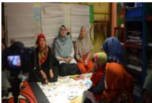
Foto Dokumen Pelaksanaan Kegiatan