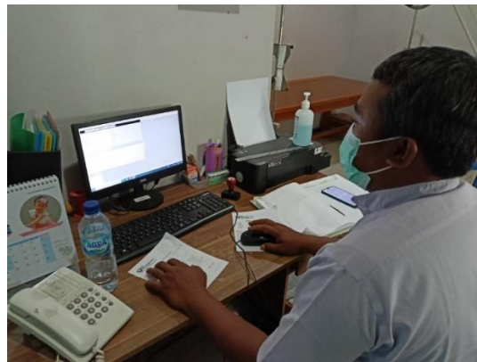
Gambar 6. Input data pasien secara digital melalui HIS di instalasi radiologi.