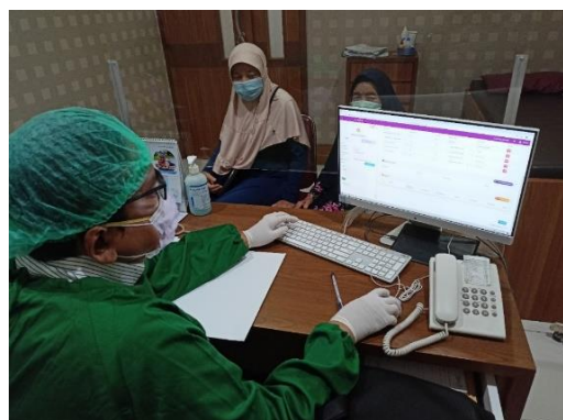
Gambar 4. Penggunaan e-medical untuk hasil pemeriksaan pasien oleh dokter spesialis di poliklinik.