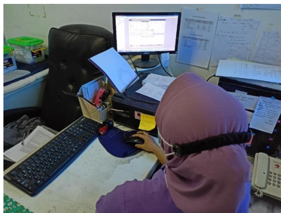
Gambar 7. Penggunaan HIS dan e-medical di laboratorium RS Mutiara Hati.