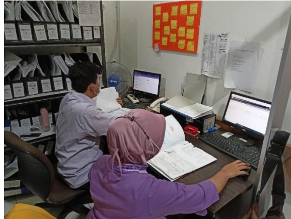
Gambar 8. Penggunaan sistem digital di bagian rekam medis RS Mutiara Hati.

Berdasarkan hasil kuisisioner, kriteria tahapan berdasarkan HIMSS EMRAM digital hospital stages and criteria dari pemodelan digital hospital yang dijalankan di RS Mutiara Hati Subang berada pada tahap 1 dengan kategori sesuai (274) dan berada pada tahap 3 dengan kategori sesuai (500). Namun ketika dikombinasikan dengan fakta yang diperoleh dari hasil wawancara, observasi serta dokumentasi, maka kriteria tahapan digital hospital yang sesungguhnya & paling sesuai bagi RS Mutiara Hati Subang adalah berada pada tahap 1 karena apotek atau instalasi farmasi, laboratorium dan radiologi sudah menggunakan HIS non-medical untuk proses administrasi berikut data pasien dan proses billing . Selain itu instalasi farmasi juga sudah menggunakan HIS medical (e-medical) untuk melayani persepsan obat dari dokter di poliklinik yang terintegrasi secara digital melalui e-medical dokter. Kemudian laboratorium juga sudah menggunakan e-medical untuk melakukan input hasil pemeriksaan lab secara digital meskipun hasilnya belum terintegrasi dengan e-medical dokter di poliklinik.