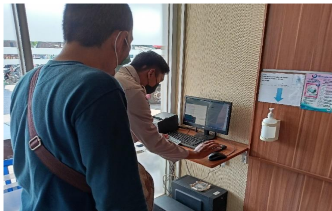
Gambar 1. Proses pendaftaran pasien secara offline melalui Aplikasi SIPINTAR pada komputer yang ada di lobby RS Mutiara Hati Subang.