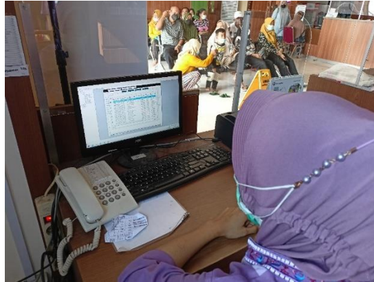
Gambar 5. Penggunaan HIS medical ( e-medical ) di instalasi farmasi RS Mutiara Hati Subang.