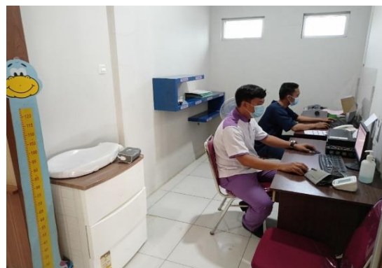
Gambar 3. Penggunaan HIS untuk pengkajian keperawatan rawat jalan kepada pasien dan proses billing oleh perawat melalui komputer yang ada di nurse station RS Mutiara Hati Subang.