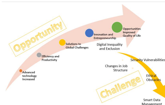
Gambar 1. Model Peluang dan Tantangan Masyarakat 5.0

Secara keseluruhan, hasil penelitian menegaskan bahwa Masyarakat 5.0 membawa potensi transformasi besar, namun tantangan seperti ketidaksetaraan, keamanan data, dan pergeseran pekerjaan harus diatasi secara proaktif untuk memastikan bahwa manfaatnya dapat dirasakan secara inklusif dan berkelanjutan oleh seluruh masyarakat. Dengan merinci peluang dan tantangan ini, penelitian ini memberikan kontribusi penting dalam membimbing pengembangan kebijakan dan strategi implementasi Masyarakat 5.0.