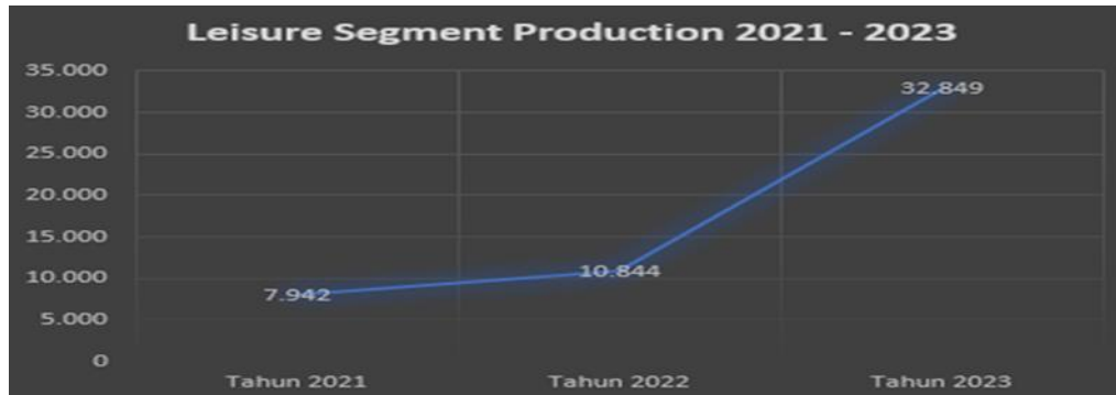
Gambar 2. Leisure Segment Production

Dengan adanya peran leisure sales dalam menjual hunian hotel, maka perlu diketahui bagaimana peranannya memiliki dampak positif serta menguntungkan bagi perusahaan. Berdasarkan dari pengumpulan dan analisis data yang dilakukan penulis, dapat diketahui bahwa peranan leisure sales di movenpick resort sangat memberikan pengaruh besar dalam meningkatkan occupancy hotel.