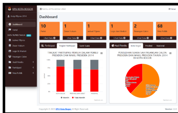
Gambar 10. Halaman Dashboard (Backend).

Halaman Dashboard merupakan halaman tampilan backend dari website sistem admin KPU Kota Bogor. Halaman ini menampilkan jumlah hasil data yang disimpan di database yaitu data partai, data kecamatan, data kelurahan, data hasil partisipasi berdasarkan tingkat partisipasi dan surat suara dalam berbentuk diagram batang dan juga data hasil pemilu berdasarkan Kota Bogor, Provinsi, dan tingkat nasional dalam berbentuk diagram lingkaran. Halaman dashboard ditunjukkan pada Gambar 10.