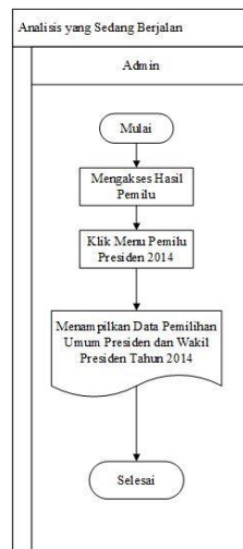
Gambar 2. Analisis yang Sedang Berjalan