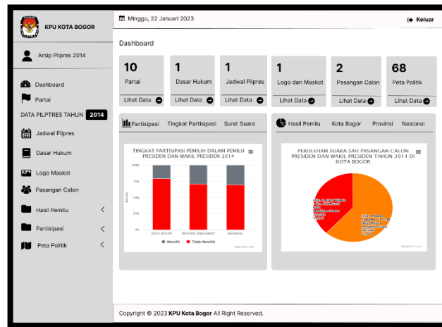
Gambar 8. Desain Antarmuka Dashboard (Backend)

Desain antarmuka dashboard merupakan halaman utama tampilan backend akun arsip saat berhasilnya login dan tampilan ini menampilkan jumlah hasil data partai, data kecamatan, data kelurahan, data hasil partisipasi berdasarkan tingkat partisipasi dan surat suara dalam berbentuk diagram batang dan juga data hasil pemilu berdasarkan Kota Bogor, Provinsi, dan tingkat nasional dalam berbentuk diagram lingkaran . Desain antarmuka dashboard ditunjukkan pada Gambar 8.